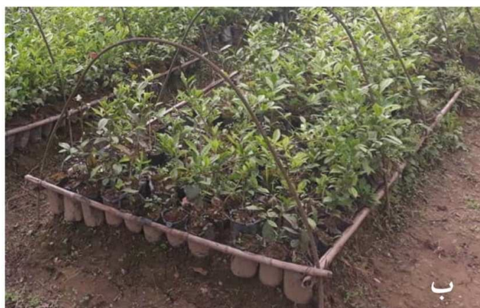
شکل ۲. قلمه‌های کشت‌شده در بستر معمولی بعد از انجام تیمار (ب) قلمه‌های کشت‌شده در گلدان پلاستیکی بعد از ریشه‌دار شدن (ب)